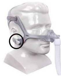
Figura 4: Maschera nasale Wisp e Wisp Youth