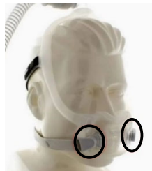
Figura 3: Maschera facciale totale DreamWear