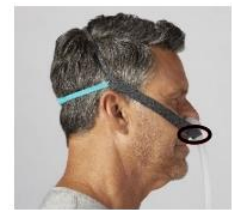
Figura 5: Maschera per terapia 3100 NC/SP