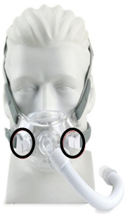
Figura 1: Maschera facciale totale Amara View

Di seguito sono riportate le immagini delle maschere interessate. Le clip magnetiche del reggimaschera su queste maschere sono cerchiare. Può utilizzare queste immagini come riferimento per stabilire se anche la Sua maschera o quella del paziente utilizzano clip magnetiche per il reggimaschera. Queste maschere hanno lo scopo di fornire un'interfaccia per l'applicazione della terapia CPAP o bi-level ai pazienti. I numeri di parte delle maschere e dei relativi componenti interessati che contengono magneti sono elencati nella Figura 6.