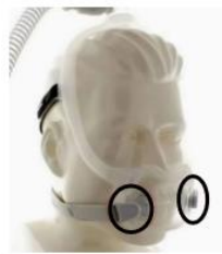
Figura 3: Maschera facciale totale DreamWear