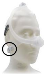
Figura 2: Maschera nasale DreamWisp