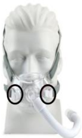
Figura 1: Maschera facciale totale Amara View

Di seguito sono riportate le immagini delle maschere interessate. Le clip magnetiche del reggimaschera su queste maschere sono cerchiare. Può utilizzare queste immagini come riferimento per stabilire se anche la Sua maschera o quella del paziente utilizzano clip magnetiche per il reggimaschera. Queste maschere hanno lo scopo di fornire un'interfaccia per l'applicazione della terapia CPAP o bi-level ai pazienti. I numeri di parte delle maschere e dei relativi componenti interessati che contengono magneti sono elencati nella tabella allegata all'Avviso Philips.