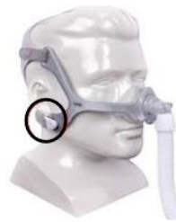
Figura 4: Maschera nasale Wisp e Wisp Youth