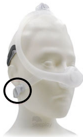
Figura 2: Maschera nasale DreamWisp